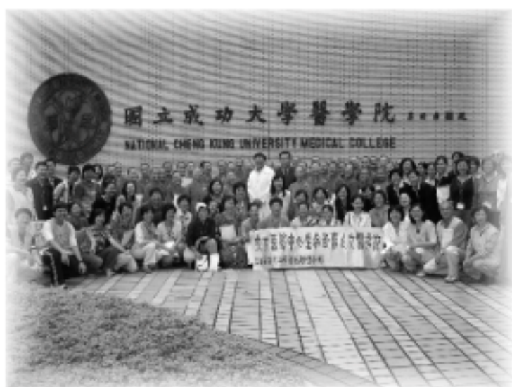
▲器官移植小組成員與學員大合照