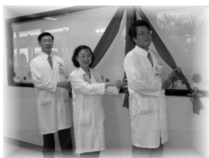
▲靜心房剪綵啟用為歷史性的一刻。