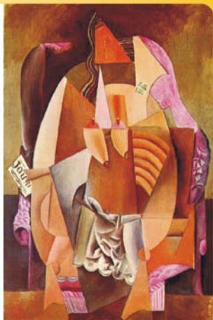
▲圖九、Woman in arm chair(1913).