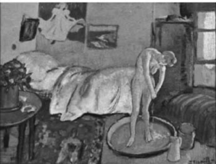
▲圖一、La chambre bleue (Le tub), Paris. 1901. Oil on cardboard, 50, 8 x 62 cm. Formely Oxford, Ashmolean Museum; The Phillips Collection, Washington, DC. OPP.01:27; Z.I:103; P.I:694; MF.01:18p

畢加索於一八八一年十月廿五日生於西班牙的 Malaga。父親 José Ruiz Blasco 為美術教師，母親為 Maria Picasso Lopez。畢加索很早便才華洋溢，於十歲時便完成第一幅作品，十二歲時，其妹妹 Conchita 患白喉病，他向神許願，願以聖誕禮物及從此封筆以換取她的痊癒，但卻事與願違，畢加索對她的死心有愧疚，另一方面亦無法接受神見死不救的冷酷，自此將神與魔畫上等號，甚至很多時候自比耶穌，日後畫作也多源於他對死亡及權力的奧秘而來。畢加索十五歲時，以優異的成績考取巴賽隆那藝術學院。在1898年間，他常以父親的名字 Ruiz 及母親的小名 Picasso 作為作品上的簽名，自1901起，他停止使用 Ruiz，而僅以母親的小名簽署其畫作。其間小名簽署其畫作，在這段時期，他曾以描寫醫生、修女及於母親病榻旁的小童為題的「科學與慈悲」一畫獲得金獎。