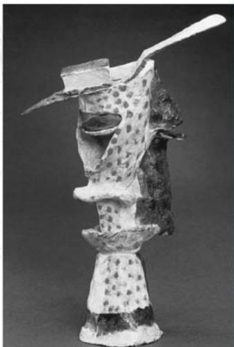
▲Glass of Absinthe(1914).