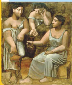
◀圖八、Three Women at the Spring (1921). Oil on canvas 203x174 cm

Spring (圖八)，及受神話故事影響的作品如The Pipes of Pan等皆是該時期的代表作。同時，畢加索亦創作了不少怪異的畫作，其中如頭部細小的冰者，或極度扭曲之女性畫像，這或許暗示著他婚姻生活中的不協調。雖然他一再否認自己是超現實派畫家，他的作品卻有不少具超現實及使人困擾的特質，如Sleeping Woman in Armchair (圖九) 及 Seated Bather (圖十)。畢氏的上流社會生活，或許使他有如置身於神話世界中，所遇見的人物如同八部天龍，才有那麼多超現實作品的出現吧！