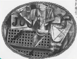
▼圖四、Still Life with Chair Caning