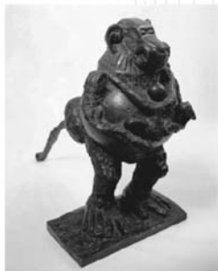
▲Baboon and young(1951).