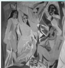
▲圖三、Les demoiselles d'Avignon. Paris. June-July/1907. Oil on canvas. 243, 9 x 233, 7 cm. The Museum of Modern Art, NYC. OPP. 07.01; Z.IIa:18; DR:47; RP:91:15