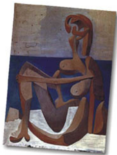
▲圖十、Seated Bather(1930). Location: Museum of Modern Art, New York