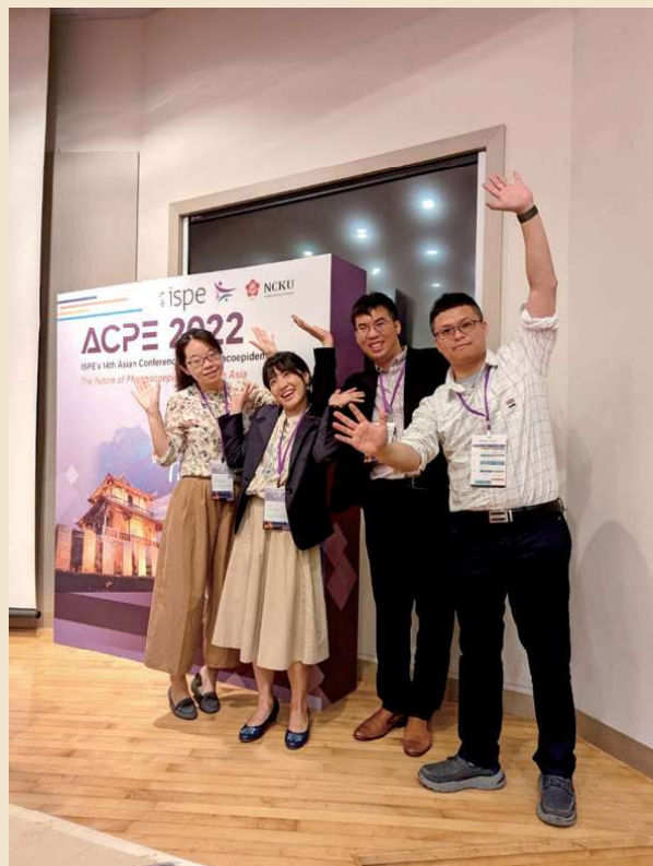
圖：臨藥所博士生們舉行的座談會結束後的合影

從醫學院的中庭踏出，夜風帶著往事的歡笑與成就，如一曲低吟的歌聲，涼爽地撫過我的面龐。在這沉靜的夜晚，每一步都像是翻開的回憶，每一道星光都好像是舊日的痕跡。抬頭遙望，星空如銀河般灑落，每一顆星星都像是過去、現在和未來的故事，記錄著我們一同走過的路和每一刻的情感。