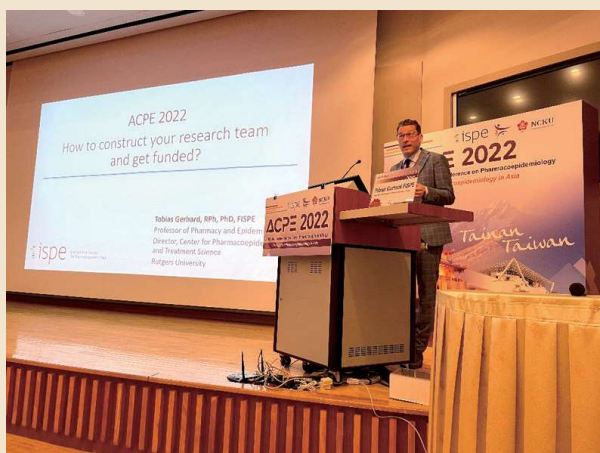
圖：symposium 邀請藥物流行學會會長 Tobias Gerhard 分享其中的一個主題

要。當我們以採訪者的角色在進行調查時，面對語言和理解障礙會遇到不少困難，但每次都是一次難得的學習經驗。