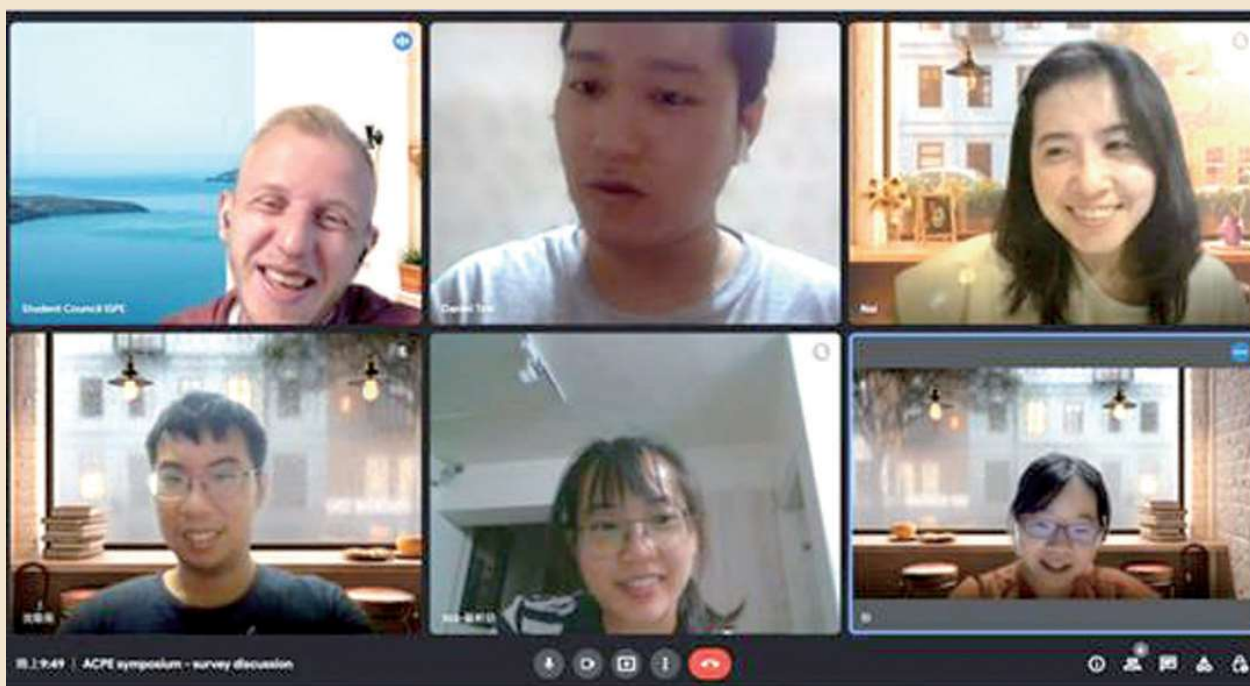
圖：博士班學生們在晚上時間跟國際藥物流行病學會學生會前會長的線上會議