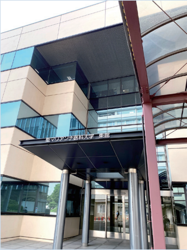
圖二：神外醫局所在的大樓

的論文，不僅有美如畫的手術步驟講解 MSLP、當然還提供了實際數據來驗證這個方法對病人術後的頸部活動度、肌肉保留程度與脊椎排列穩定度的影響。我手裡繼續翻著作者親印給我的論文，一邊對照眼前 table 上的手術步驟，頓時感到一種，站在歷史巨流裡的沁然。我想起主任當時對我說的“ Oh! You know Hirabayashi! ”不免讓人有小小的成就感！